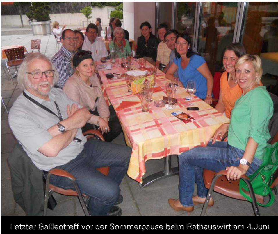
Letzter Galileotreff vor der Sommerpause beim Rathauswirt am 4. Juni