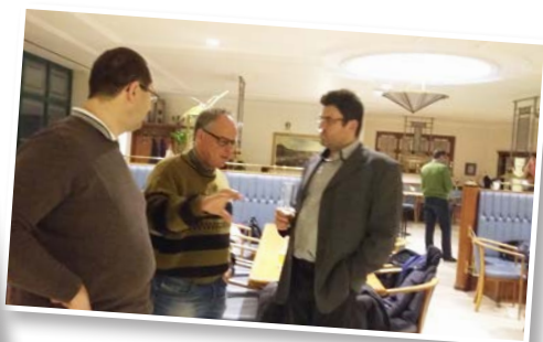
„A schwarze Partie“